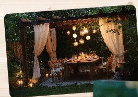
アウトドア ガーデニング