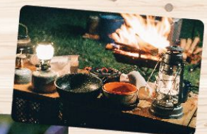
あなたらしさが 活きる空間