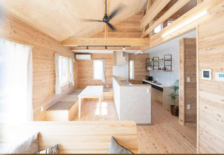
差し込む光が木の壁に美しい陰影をつくり 開放感あふれる1階は回遊する動線が生活を快適に